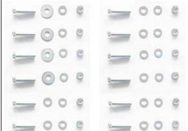
а. Крепёж в комплекте (винт 8*45, шайбы, гайка) - 12 шт.