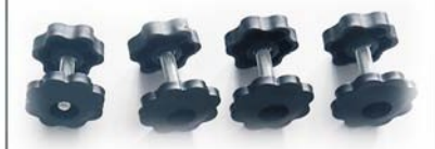
е. Регулировочная ручка - 4 шт.