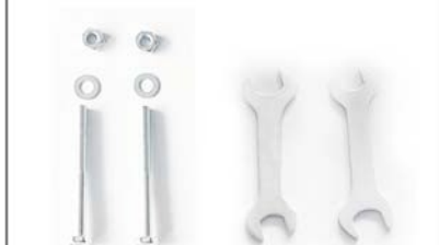
д. Крепёж в комплекте (винт 8*80, шайба, гайка), гаечный ключ-2 шт.