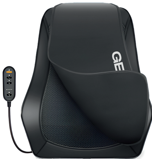
Подушка для массажа шиацу с подогревом