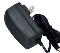
Адаптер 12 В